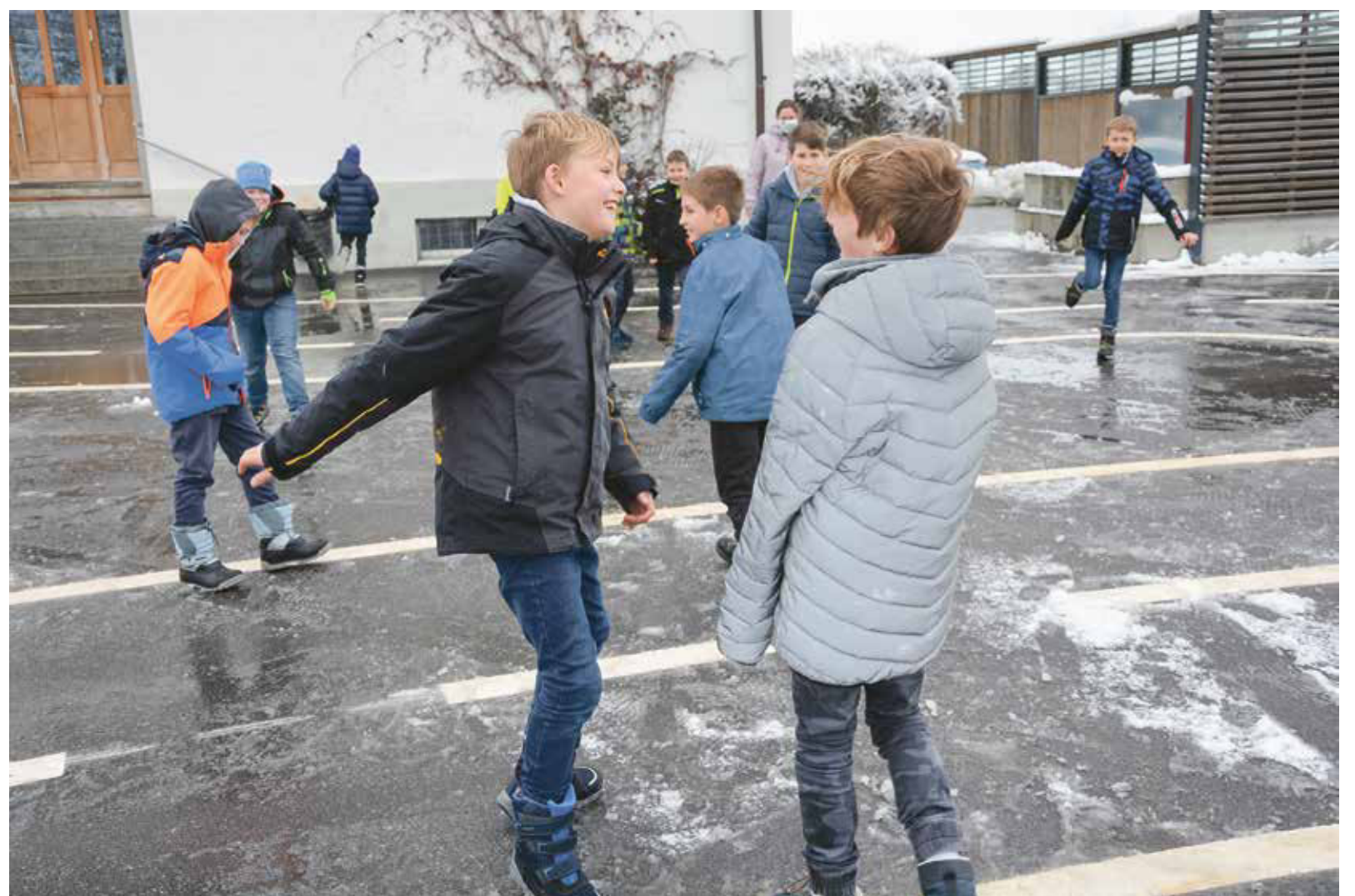
Entspannen geht auf dem Pausenplatz auch spielerisch.