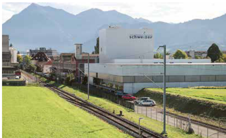
...und das heutige Firmenareal an der Maienstrasse in Steffisburg.