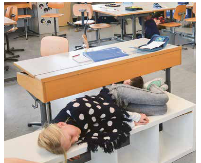
Entspannen geht liegend am besten.